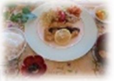
さっくさくジューシー♪ 「実演☆トンカツ」