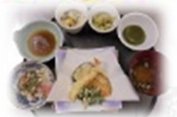
初夏の風香る 「山菜ちらしの和食御膳」