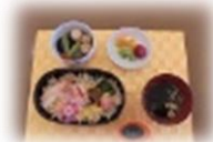
ナーブ大人気のお寿司シリーズ 「海鮮散らし寿司」