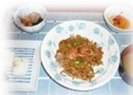
ソースが香る、かつおが踊る♪ 「実演★焼きそば」