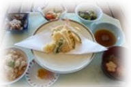
春の旬 たけのこづくし 「たけのご御膳」